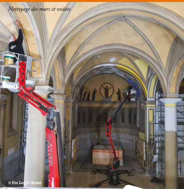
Nettoyage des murs et voûtes